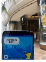
2. DFSギャラリア周辺 55.0Mbps