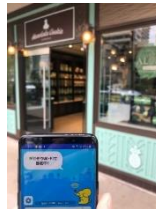
11. ホノルルクッキー カンパニーワイキキビーチ マリオット店周辺 148.0Mbps