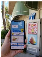
8. ローソン ステーション周辺 5.5Mbps