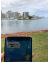
1. マジックアイランド周辺 16.9Mbps