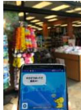
ワイキキ地区（一部）では、ホーム画面「接続中の SSID」に「Beach Wi-Fi」と表示されます

このたびのエリア拡大では、「ギガぞう」で自動接続可能な新しい SSID「Beach WiFi」をワイキキ地区のメインストリートであるカラカウア通り、クヒオ通りをはじめとする一部エリアでご利用いただけるようになります。