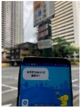
13. バス停周辺 18.3Mbps