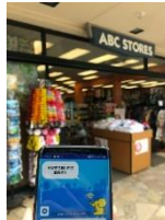
10. ABC stores #14 周辺 20.3Mbps