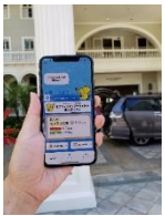
8. ローソン ステーション周辺 5.5Mbps