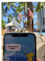
9.デューク カハナモク像周辺 1.2Mbps