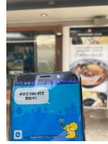
3. Marukame UDON 周辺 14.3Mbps