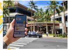
6. インターナショナル マーケットプレイス周辺 5.1Mbps