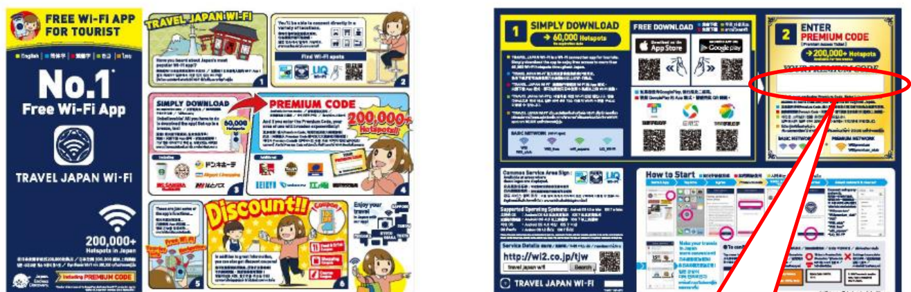
配布パンフレットイメージ