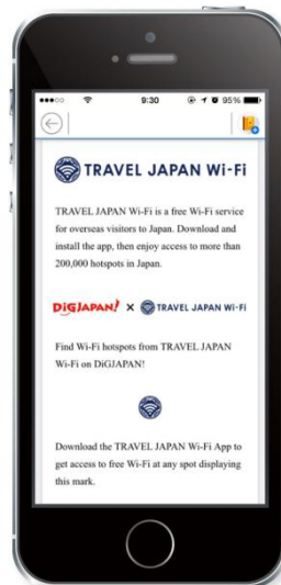
一覧の先頭をタップすると、 「TRAVEL JAPAN Wi-Fi」 説明画面が表示されます