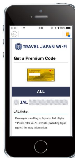
プレミアムコード配布 企業・入手可能場所も 確認できます。