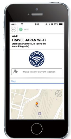
「TRAVEL JAPAN Wi-Fi」 利用可能スポットの地図が 確認できます。

「DiGJAPAN !」アプリ TOP 画面より、『Wi-Fi』ボタンをお選びいただきますと、最寄りのアクセスポイント一覧が表示されます。また、一覧の先頭には「TRAVEL JAPAN Wi-Fi」アプリ概要とダウンロード方法の説明、「TRAVEL JAPAN Wi-Fi」参画企業が提供するプレミアムコードが取得できる施設等を掲載しています。