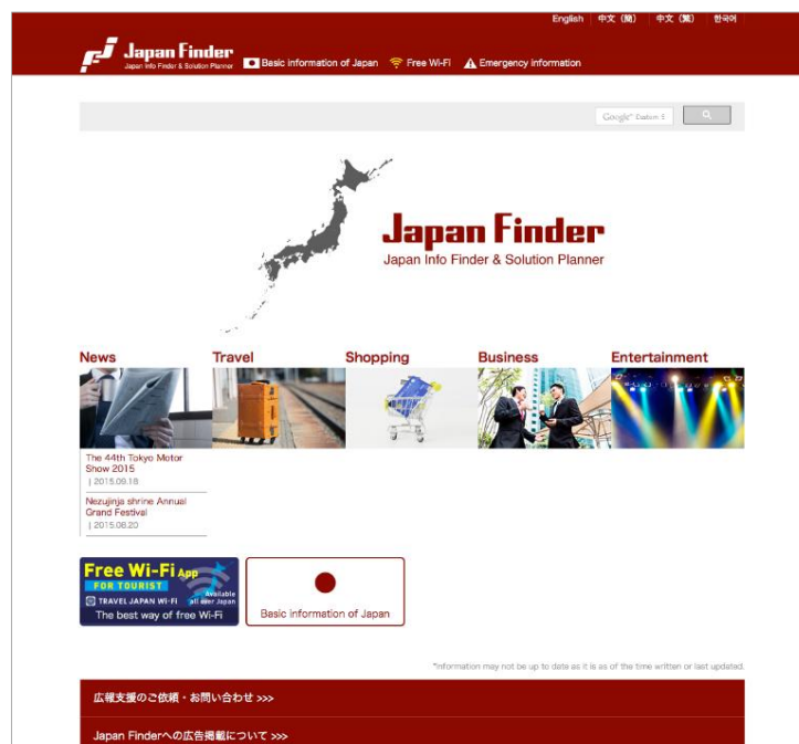
図 1 : Japan Finder web サイト(イメージ)

「Japan Finder」とは本日オープンする観光、グルメ、食品ならびに食周辺製品、エンターテインメント、ビジネスなど日本の魅力を世界に発信する総合多言語(英中韓)情報プラットフォームです。外国人利用者の利便性を高める為、「TRAVEL JAPAN Wi-Fi」に加え、旅行プランナー、3者間通訳、クーポン配信のサービスを提供します。