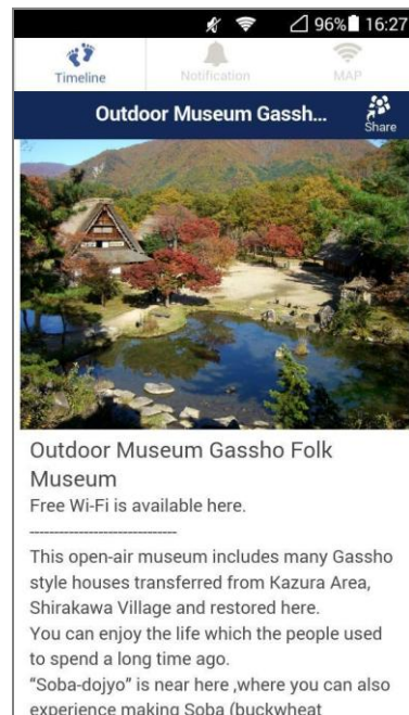
【配信コンテンツイメージ】