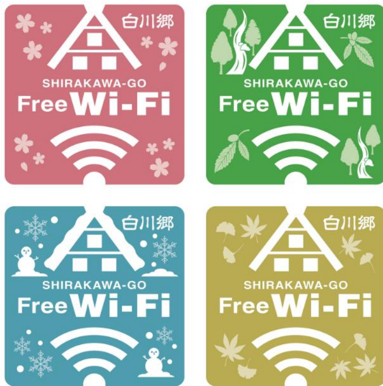
【四季をイメージした4種類のエアサイン】