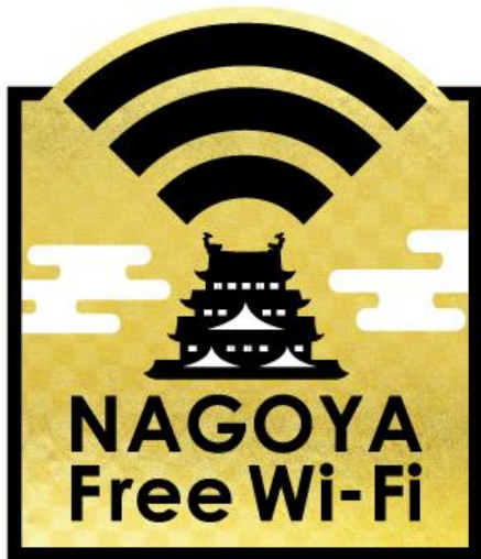
図1 : NAGOYA Free Wi-Fi エリアサイン