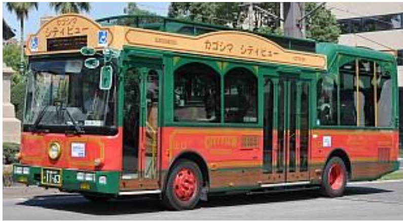
カゴシマシティビュー

よかところかごんまナビ HP: http://www.kagoshima-yokanavi.jp/kotsu/kagoshima/cityview.html