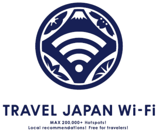
図4: サービスブランドロゴ