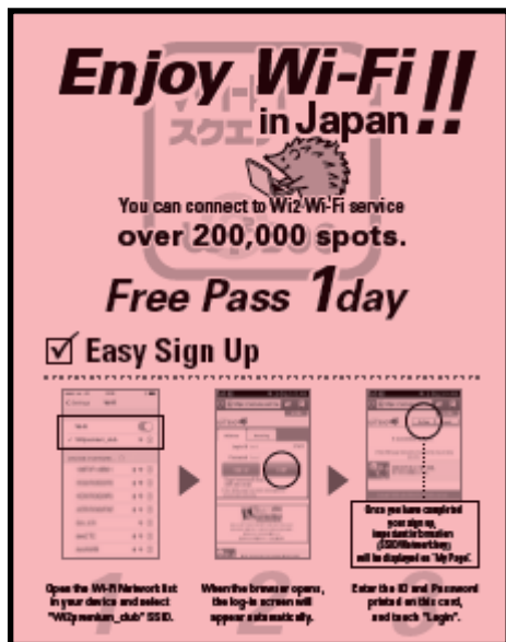
図 1: ワンタイムチケット(1day)