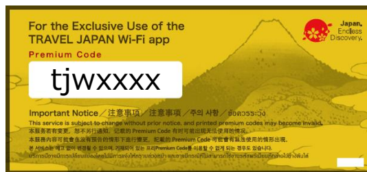
図 2: 「TRAVEL JAPAN Wi-Fi」プレミアムコード